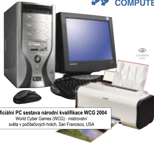
Oficiální PC sestava národní kvalifikace WCG 2004 World Cyber Games (WCG) - mistrovství světa v počítačových hrách, San Francisco, USA