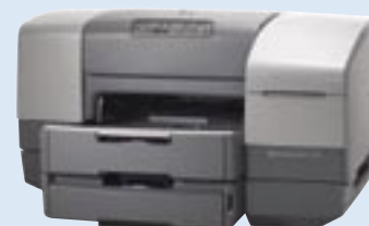
hp business inkjet 1100d

Inkoustová tiskárna ideální pro tisk fotografií kvalita tisku 4800 x 1200 dpi barevně s optimalizací a 1200 x 1200 dpi čb, tisk bezokrajových fotografií velikosti 10 x 15 cm a formátu A4, tisk 6-ti druhů inkoustů s technologií HP PhotoREt IV, čtečka na 11 druhů paměťových karet (CF, MicroDrive, SM, SD, MultiMedia, Memory Stick, xD Picture Card), LCD displej, rozhraní USB.