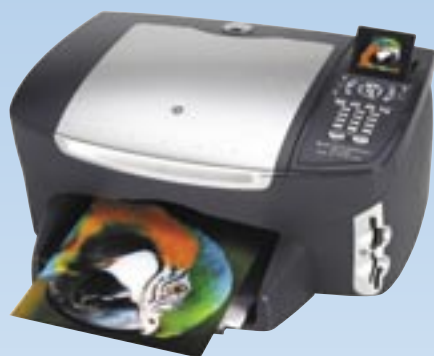
hp psc 2510