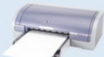
hp deskjet 5150c

Vysokorychlostní barevná inkoustová tiskárna vhodná pro domácí použití a pro menší pracovní skupiny, rychlost tisku až 23 str./min. čb, 20 str./min. v barvě, precizní detailní tisk s technologií HP PhotoREt III, pracovní zatížení až 6000 str. za měsíc, nízké náklady na tisk - oddělené tiskové hlavy, automatický oboustranný tisk, rozhraní: USB a paralelní port.