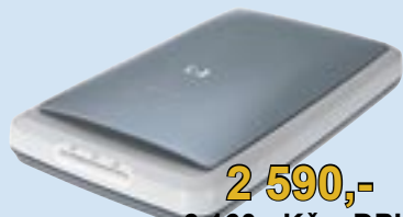
hp scanjet 3670

Inkoustová tiskárna formátu A4 s moderními fotografickými funkcemi, rozlišení až 4800 dpi v barvách, volitelný šestibarevný tisk s technologií HP PhotoREt IV, rychlost tisku až 19 str./min. čb a až 14 str./min. v barvě, všestranný podavač papíru, tisk bez okrajů na formáty A4 i 10 x 15 cm, využití až 3 000 str./měsíc, rozhraní USB 2.0