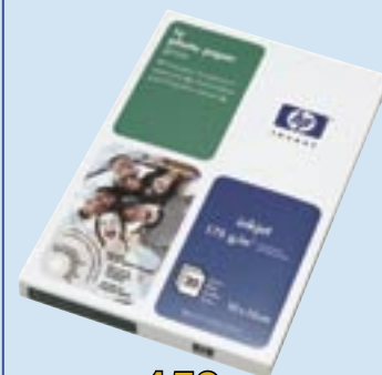
HP fotopapír C7891A

Monochromatická laserová tiskárna formátu A4. Rozlišení 600 x 600 dpi s REt. Rychlost tisku 12 str./min. Paměť 8 MB RAM. Tiskový jazyk: GDI. Vstupní kapacita 150 listů. Rozhraní USB 2.0. Doporučené měsíční zatížení 5.000 str./měsíc.