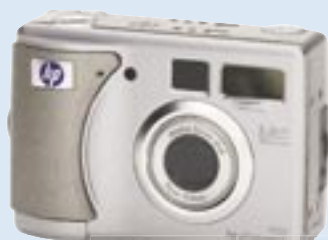
hp photosmart 935

Barevná tiskárna-kopírka-skener-fax. Tisk: technologie tisku hp photoret IV s optimalizovaným rozlišením 4800 dpi, volitelný šestibarevný inkoustový tisk špičkové kvality, tisk bez okrajů na fotopapíru 10x15 cm, až 17 str./min. čb, až 12 str./min. v barvě. Vstupní podavač pro 100 listů. Fax: barevný průtahový, faxování bez PC, podavač na 20 listů, 90 čísel předvolby. Skener: ploché lože, optické rozlišení 600 x 2400 dpi, 36-bitová barva, 256 odstínů šedé. Kopírování: 17 kopií/min. čb, 12 kopií/min. v barvě, až 99 kopií z jedné předlohy, zoom 25 - 400% z kopírovací desky. Rozhraní USB.