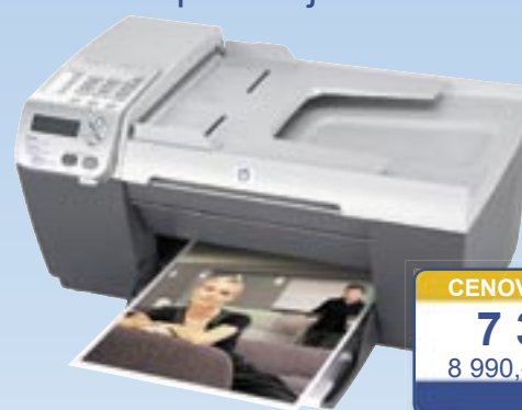
hp officejet 5510

Barevná tiskárna-kopírka-skener-fax-čtečka PC karet s možností přímého tisku bez okrajů. Tisk: rozlišení 1200 dpi čb, HP PhotoREt IV v barvě, až 21 str./min. čb, až 15 str./min. v barvě. Vstupní podavač pro 150 listů, výst. 50 listů. Automat. rozpoznávání typu papíru. Barevný display 6,4 cm. Skener: plochý, optické rozlišení 1200 x 2400 dpi, 48bit barevná hloubka. Kopírování: až 21 kopií/min. čb, až 14 kopií/min. v barvě, opakování až 50 kopií, zoom 25 až 400%. Fax: modem 33,6 kB/s, paměť na 50 stránek, předvolba až pro 60 čísel, barevné faxování. Integrovaná čtečka PC karet: CF I, II, SM, Sony Memory Stick/Duo/Pro, SD, IBM Microdrive, Multimedia, Secure Multimedia, xD Picture Card. Měsíční zatížení 5.000 stránek. Rozhraní USB, Wireless Ethernet 802.11b/WiFi, Wired Ethernet 802.3.