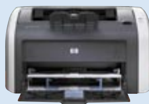
hp laserjet 1010

Stolní barevný plochý skener. Tlačítka na čelním panelu: skenování, HP Instant Share, HP Photo & Image SW. Rozlišení: 1200 dpi optické, 1200 x 1200 hardwarové, rozšířené neomezené. Barevná hloubka 48-bit. Rychlost skenování: méně než 10 sec. náhled, méně než 44 sec. pro 10 x 15 barevnou fotografii a méně než 41 sec. OCR celou stranu do MS Wordu. Zvětšení/zmenšení: 10 - 2000% s 1% krokováním. Max. velikost dokumentu: 216 x 297 mm. Integrovaný adaptér transparentních předloh ve víku skeneru. Rozhraní USB 2.0.