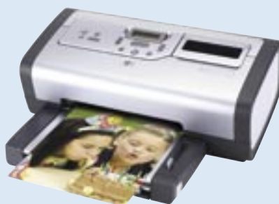
hp photosmart 7660

Digitální fotoaparát se snadnou obsluhou a špičkovým designem. Efektivní rozlišení 5,1 megapixelů (2608 x 1952), 3x optický a 7x digitální zoom, objektiv Pentax, priorita clony, makro režim, automatické a manuální vyvážení bílé, ozvučené videoklipy, okamžité prohlížení obrázků na barevném 3,8 cm LCD displeji (1,5"), paměťová karta 32 MB Secure Digital v dodávce + slot karet SD/MMC. Software HP Photo & Imaging s HP Memories Disc Creator.